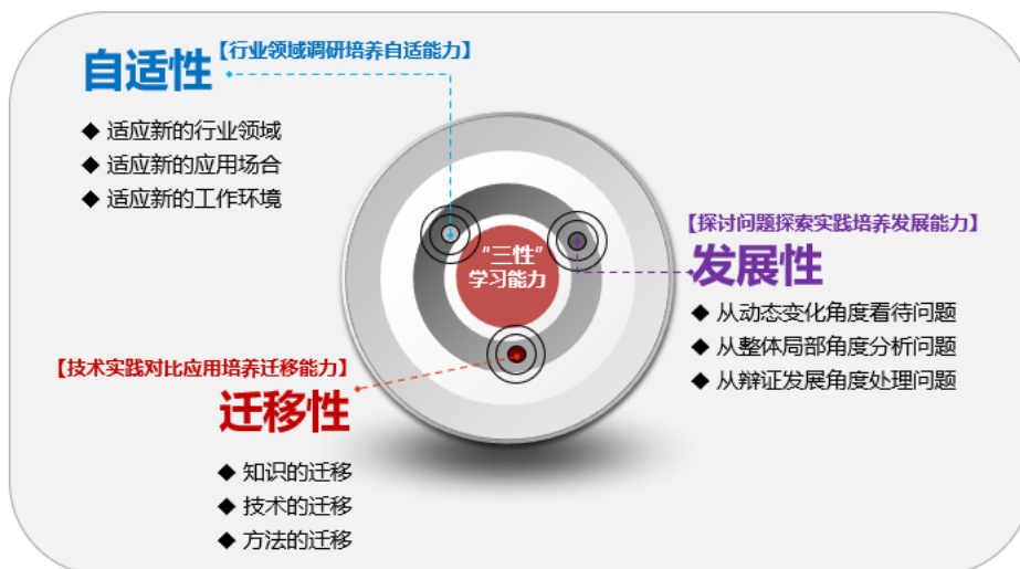
图 5-1 “三性”能力的内涵

(7) 具有一定的项目开发实践经验，具有项目开发的自适性、迁移性和发展性“三性”能力。