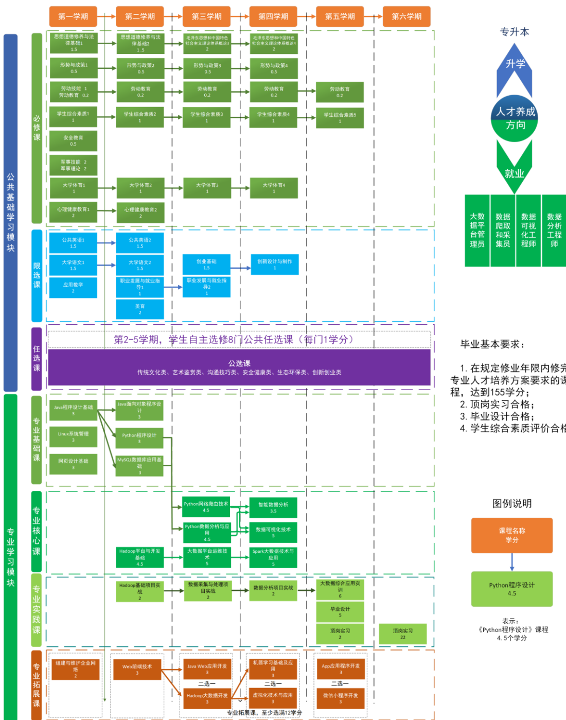
大数据技术专业课程地图（专业代码：510205）